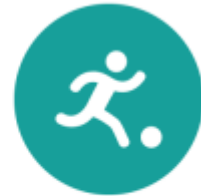
Spel en beweging / bewegingsonderwijs

Onze vakleerkracht handvaardigheid geeft lessen 'VTS', ofwel Visual Thinking strategies, in de klas. Hierbij leren kinderen op een rijke manier naar kunst te kijken, hun perceptie tegen het licht te houden en heel goed naar elkaar te luisteren.